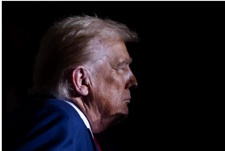
Super-Sündenbock? Donald Trump

Ähnliche Trump-Hitler-Titelbilder gab es bereits und in vielen anderen Print- und Online-Medien – auch in Deutschland, wo der „Stern“ ( https://www.faz.net/aktuell/feuilleton/medien/stern-cover-zeigt-donald-trump-mit-hitlergruss-15166547.html ) Trump mit Hitlergruß zeigte oder der „Spiegel“ ( https://www.spiegel.de/spiegel/print/index-2024-34.html ) Trump, Meloni und Höcke als „die heimlichen Hitler“ etikettierte. Selbst wenn man Trump verachtet, kann man eines nicht leugnen: Er hat in den vergangenen neun Jahren viel einstecken müssen. Standardmäßig wird er als „Nazi“, „Rechtsextremist“, „Rassist“, „Sexist“ oder Anhänger der „White Supremacy“ gebrandmarkt. Was immer er sagt oder tut, wird ihm sofort als „hasserfüllt“ ausgelegt. Das liberale Establishment in den USA – Tausende progressive Politiker, Professoren der Ivy-League-Universitäten, Journalisten der „New York Times“, von NPR und CNN sowie Institutionen wie der Atlantic Council oder das Stanford Internet Observatory – ist sich in seiner radikalen Ablehnung einig. Und diese Haltung, eher verdammend als kritisch, wird in Deutschland in Politik und Medien fast unreflektiert übernommen. Ausnahmen sind rar.